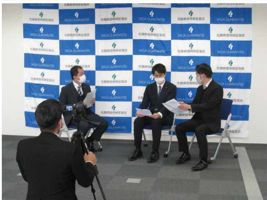
令和3年3月4日 当協会にて撮影の様子

4月から「アイテレビ」、「ちゅんちゅんテレビ」、「イレブンテレビ」で放送されますので、どうぞご覧ください。