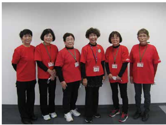
佐賀市健康ひろげ隊の皆さん

佐賀市健康ひろげ隊の皆さんをお招きして佐賀弁ラジオ体操を行いました。昨年に引き続き2度目の取組みとなります。赤いTシャツ姿の隊員の皆さんの元気に圧倒されながら日ごろの運動不足を痛感させられましたが、適度に身体を動かしながらリフレッシュできました。