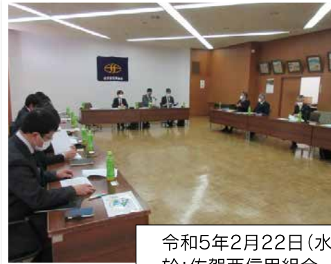
令和5年2月22日(水) 於:佐賀西信用組合 本店