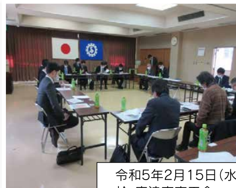
令和5年2月15日(水) 於:唐津東商工会 会議室