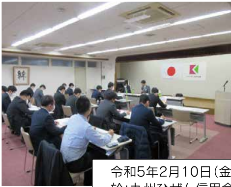
令和5年2月10日(金) 於:九州ひぜん信用金庫 本店

九州ひぜん信用金庫および佐賀西信用組合と勉強会を行いました。また、武雄市商工会、唐津東商工会の金融懇談会に出席し、情報交換を行いました。