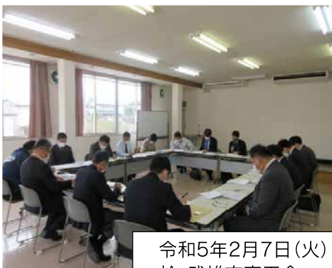
令和5年2月7日(火) 於:武雄市商工会 会議室