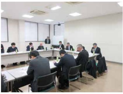
令和6年2月2日(金) 於:小城市商工会館 会議室

各地区の金融懇談会へ出席しました。各市町金融担当者、金融機関融資担当者が出席し管内の現況報告、令和6年4月からの保証申込のスキーム変更等説明がありました。