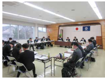
令和6年2月15日(木) 於:唐津東商工会 会議室