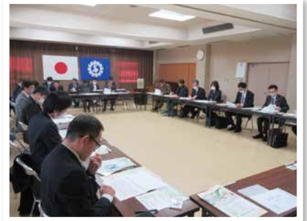
令和6年2月22日(木) 於:白石町商工会