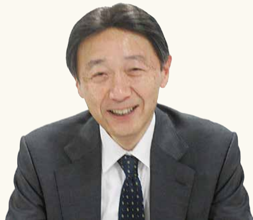
志岐経営者保証コーディネーター

佐賀県事業承継・引継ぎ支援センター 佐賀商工ビル6階 TEL.0952(27)7071