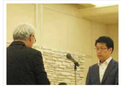
佐賀共栄銀行 唐津支店