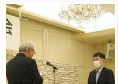
唐津信用金庫 山本支店