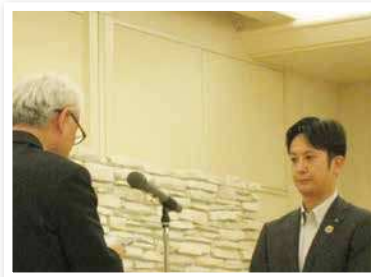
大川信用金庫 諸富支店