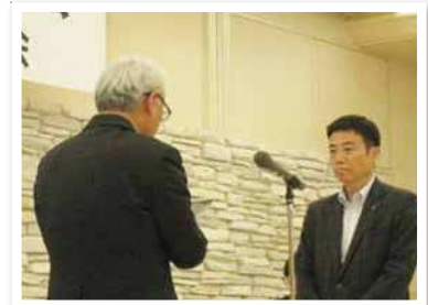
佐賀東信用組合 小城支店