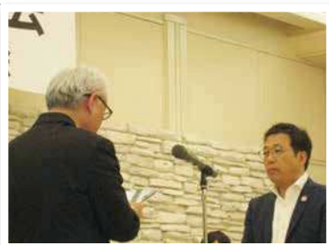
十八親和銀行 佐賀中央支店