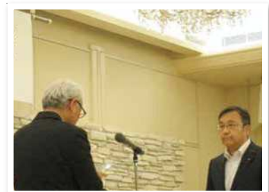
九州ひぜん信用金庫 本店営業部