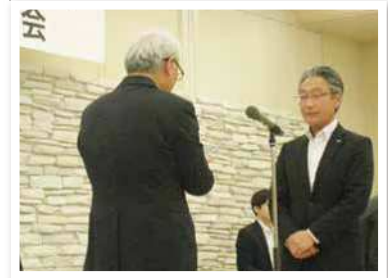
福岡銀行 唐津支店