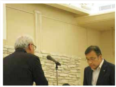
九州ひぜん信用金庫 宮野町支店