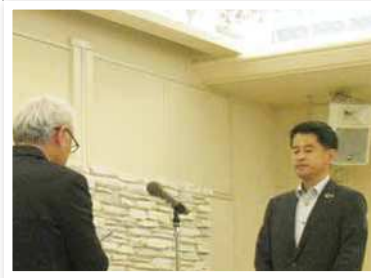
佐賀銀行 多久支店

佐賀銀行 本店営業部 佐賀銀行 多久支店 福岡銀行 唐津支店 十八親和銀行 佐賀中央支店 伊万里信用金庫 南支店 九州ひぜん信用金庫 本店営業部 九州ひぜん信用金庫 宮野町支店 大川信用金庫 諸富支店 佐賀東信用組合 小城支店