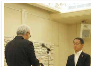
西日本シティ銀行 唐津支店