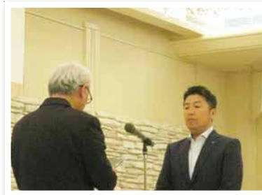
佐賀共栄銀行 佐大通り支店