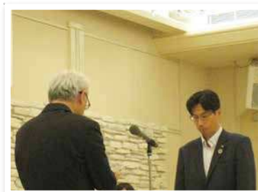
筑邦銀行 鳥栖支店

佐賀銀行 本店営業部 佐賀銀行 唐津支店 西日本シティ銀行 唐津支店 筑邦銀行 鳥栖支店 佐賀共栄銀行 佐大通り支店 佐賀共栄銀行 若宮支店 佐賀共栄銀行 鳥栖支店