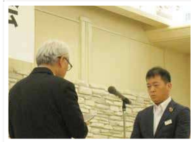
佐賀西信用組合 伊万里支店