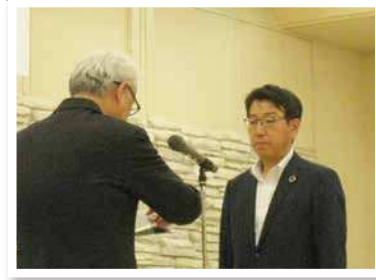
西日本シティ銀行 佐賀支店

佐賀銀行本店営業部 西日本シティ銀行 佐賀支店 筑邦銀行 鳥栖支店 十八親和銀行 佐賀中央支店 佐賀共栄銀行 鳥栖支店