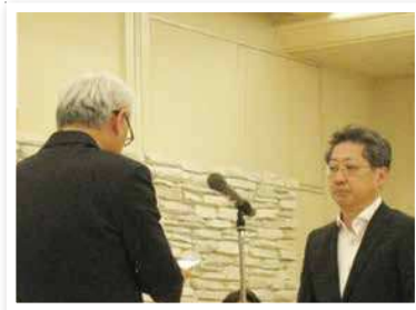
西日本シティ銀行 鳥栖支店