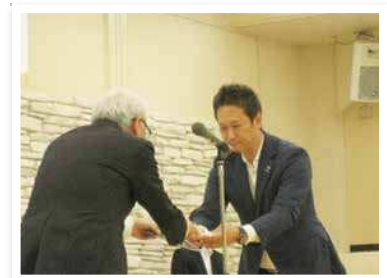
佐賀共栄銀行 鳥栖支店