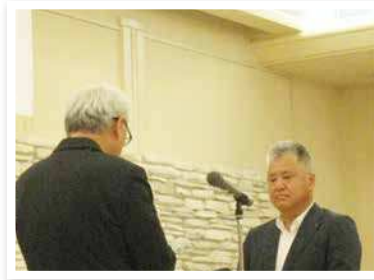
佐賀銀行 本店営業部

佐賀銀行 本店営業部 佐賀銀行 唐津支店 西日本シティ銀行 鳥栖支店 佐賀共栄銀行 佐大通り支店 佐賀共栄銀行 唐津支店