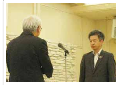
佐賀銀行 唐津支店