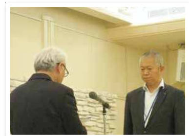
佐賀共栄銀行 若宮支店