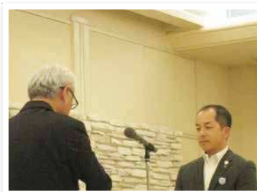
伊万里信用金庫 南支店