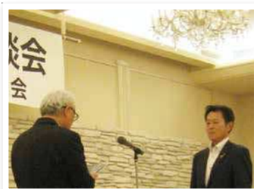
佐賀信用金庫 鳥栖支店

佐賀共栄銀行 佐大通り支店 佐賀共栄銀行 若宮支店 佐賀信用金庫 鳥栖支店 唐津信用金庫 山本支店